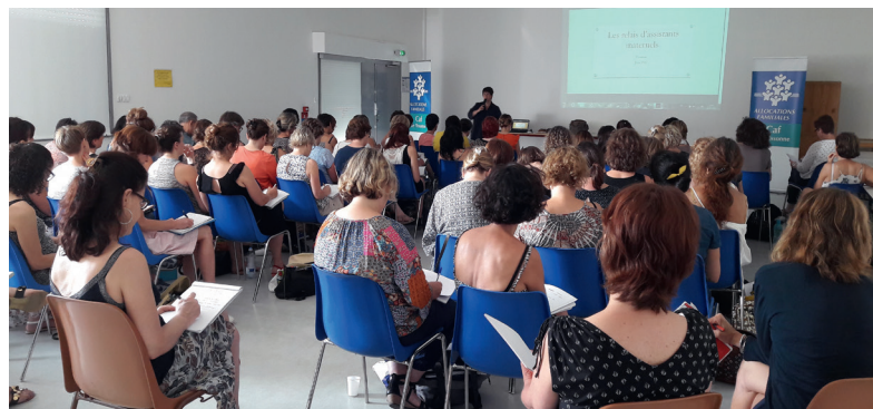
Réseau Ram - journée du 21 juin 2017 sur la posture des animatrices Ram et l'information de 1 er niveau délivrée auprès des familles et des professionnels - Caf Essonne ©

Prisma Conseil & Formation - Véra Ribault.